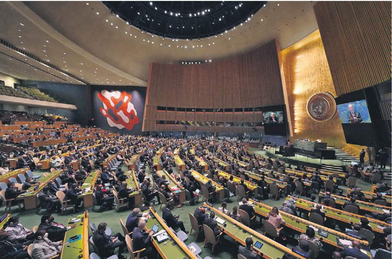
По планам организаторов «Саммита будущего» — ключевого мероприятия Недели высокого уровня Генассамблеи ООН — мировые лидеры и эксперты должны будут за два дня обсудить едва ли не все главные проблемы планеты и найти решения

В первый день мероприятия запланировано принятие Пакта будущего, а также приложений к нему — Глобального цифрового договора и Декларации о будущих поколениях. В рамках 30-страничного Пакта будущего государствам предложено пообщаться использовать «все имеющиеся у них инструменты» для решения таких проблем, как голод и нищета, неравенство, международные конфликты, изменение климата. Генсек