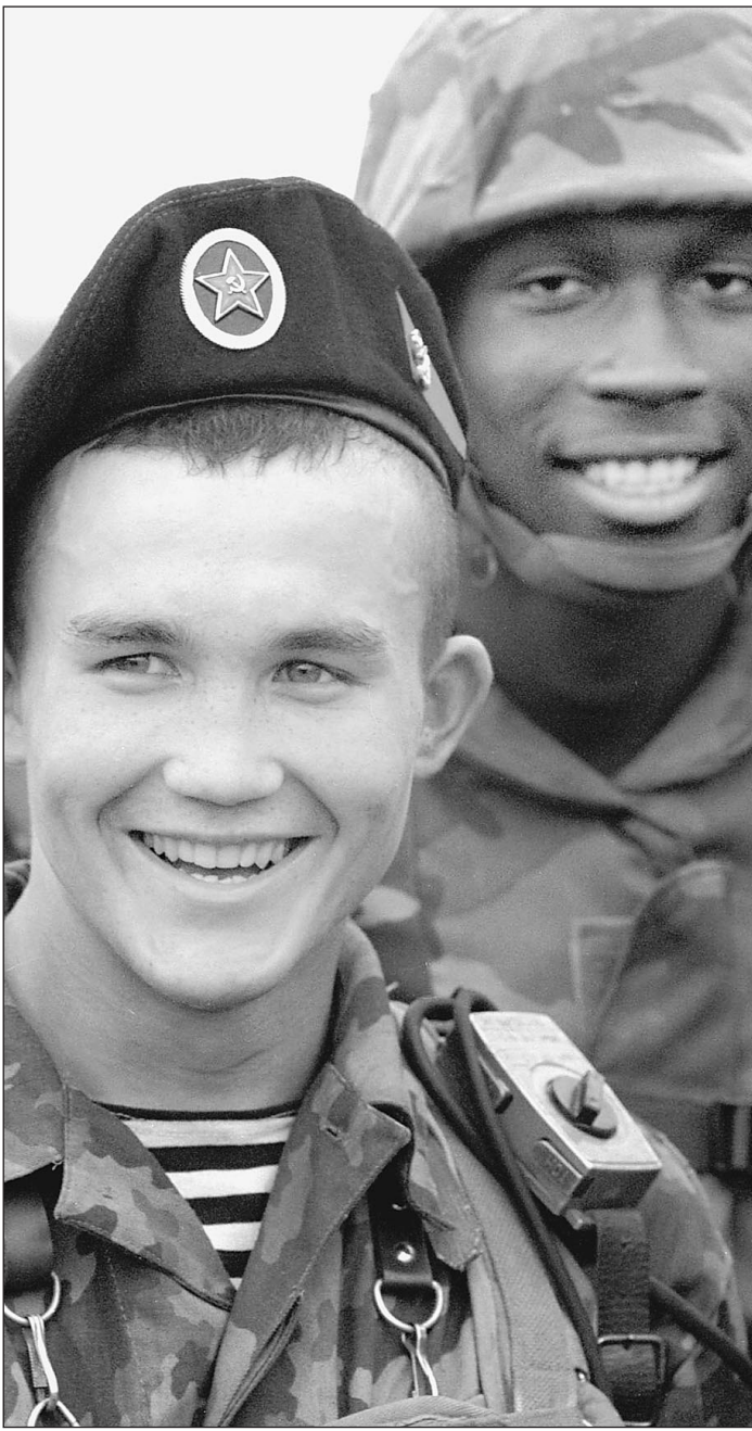
Любая военная машина начинается с людей

По сведениям «Известий», часть руководства Пентагоном без восторга восприняла информацию о переподчинении спецназа президенту США. Некоторые генералы опасаются, что по чисто политическим соображениям он может принять крайне рискованное решение, например, о массовой высадке десанта для уличных боев в Кабуле или других афганских городах. Такой поворот событий они рассматривают как «наихудший вариант».