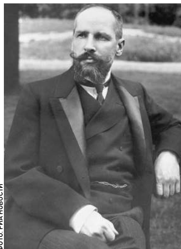
Петр Столыпин и Иосиф Сталин до последнего спорили за второе место