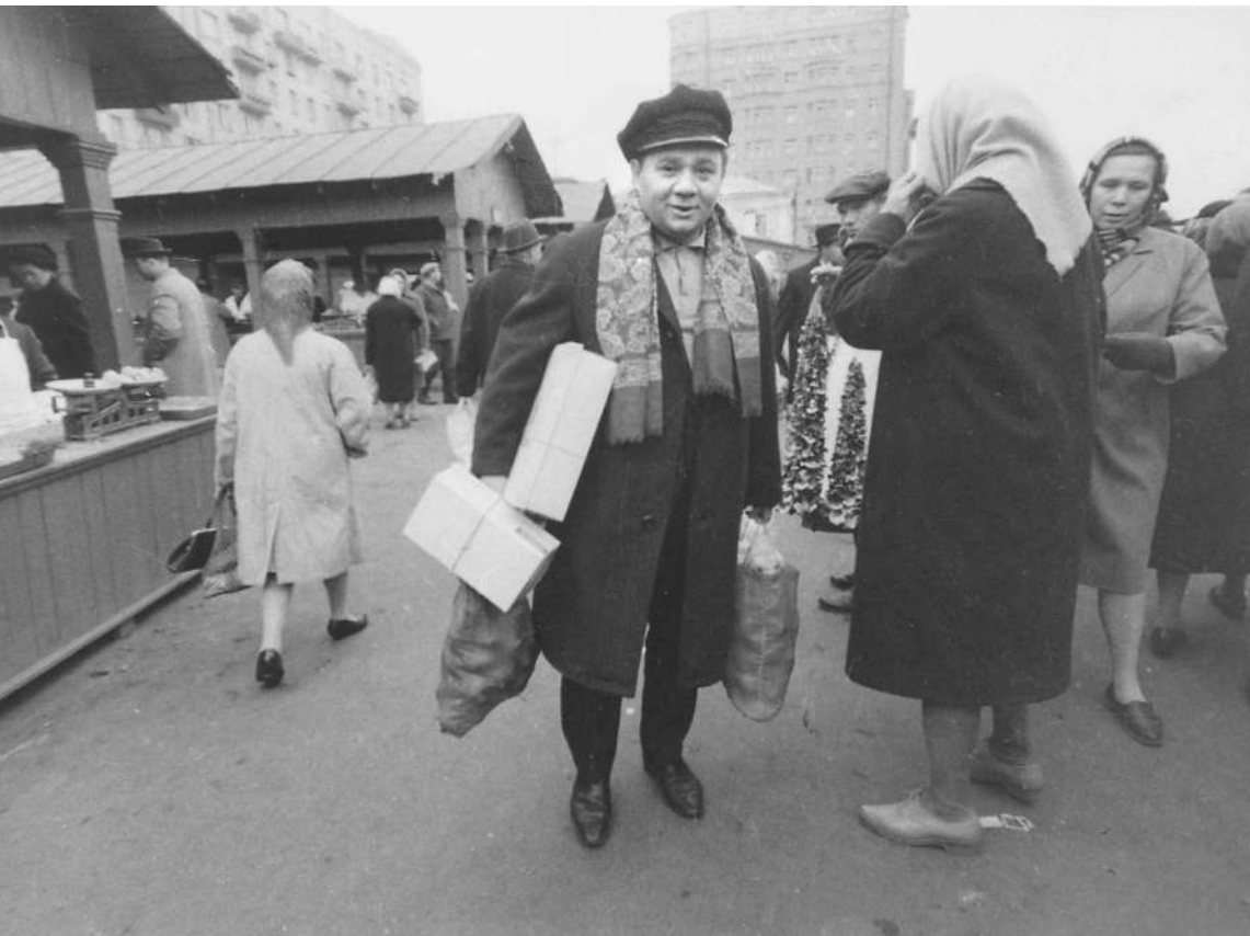
Хороший семьянин и заботливый отец Евгений Леонов на Тишинском рынке. 1970-е