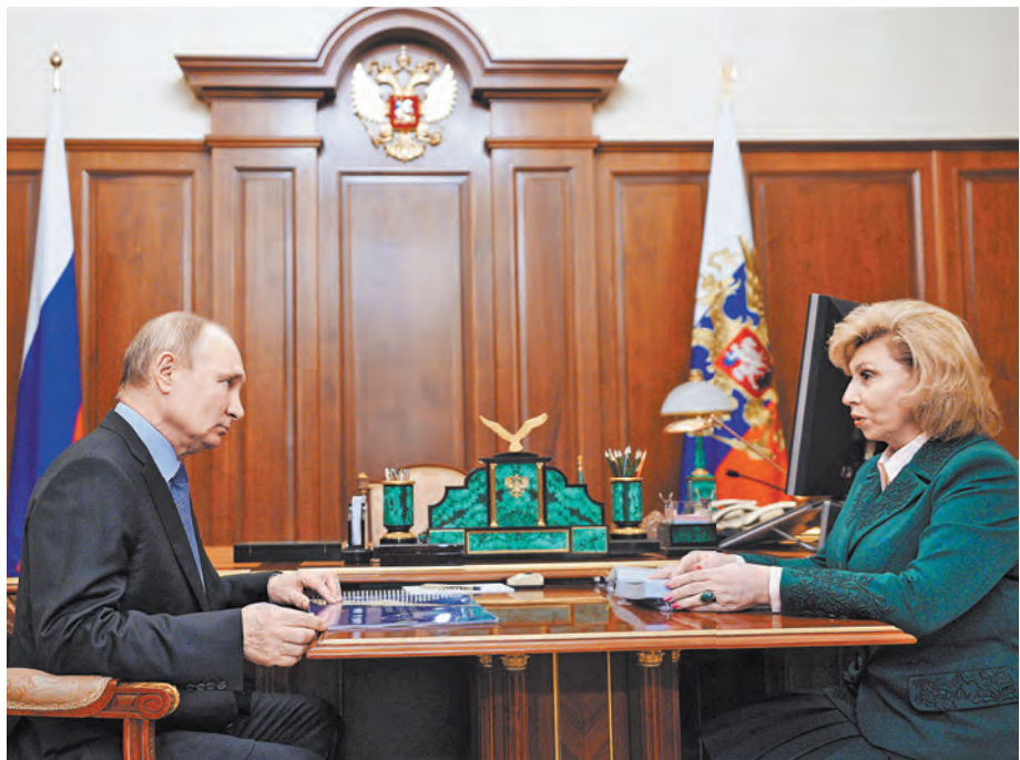
Как проходила встреча Владимира Путина и Татьяны Москальковой, читайте на с. 2.

тие «права человека» было растоптано и уничтожено, превращено в пыль нацистским режимом и его союзниками. Тем более важно сохранять память о ней, не допускать попыток замалчивания, а уж тем более — фальсификации истории Великой Отечественной войны. Из других памятных дат — 75-летие образования ООН и 70-летие Конвенции о защите прав человека и основных свобод. Очень хороший повод для всего мирового сообщества правозащитников внимательно посмотреть, не отходим ли мы от тех базовых принципов сосуществования, взаимоуважения, баланса, которые были заложены тогда. Существует ли в мире равенство, стало ли его больше, или, наоборот, разрыв между людьми и странами увеличился?