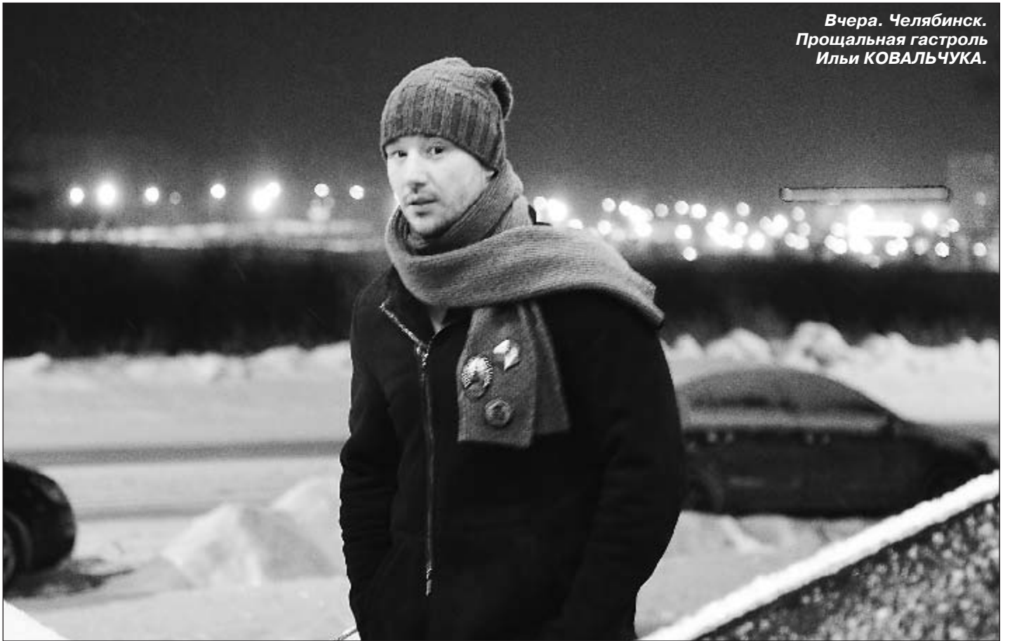
Вчера, Челябинск. Прощальная гастроль Илья КОВАЛЬЧУКА.