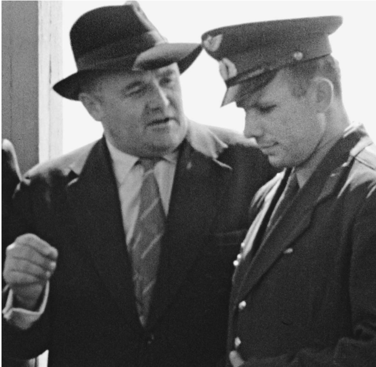
ГЕНЕРАЛЬНЫЙ КОНСТРУКТОР СЕРГЕЙ КОРОЛЕВ И КОСМОНАВТ ЮРИЙ ГАГАРИН 11 АПРЕЛЯ 1961 ГОДА

Сегодня отмечается 50-летие первого полета человека в космос. Это событие не для одной страны — для всего человечества, которое 12 апреля 1961 года вышло на новую орбиту. Заместитель Королева академик Борис Черток размышляет о причинах былых достижений и ставит для космонавтики новые рубежи →07