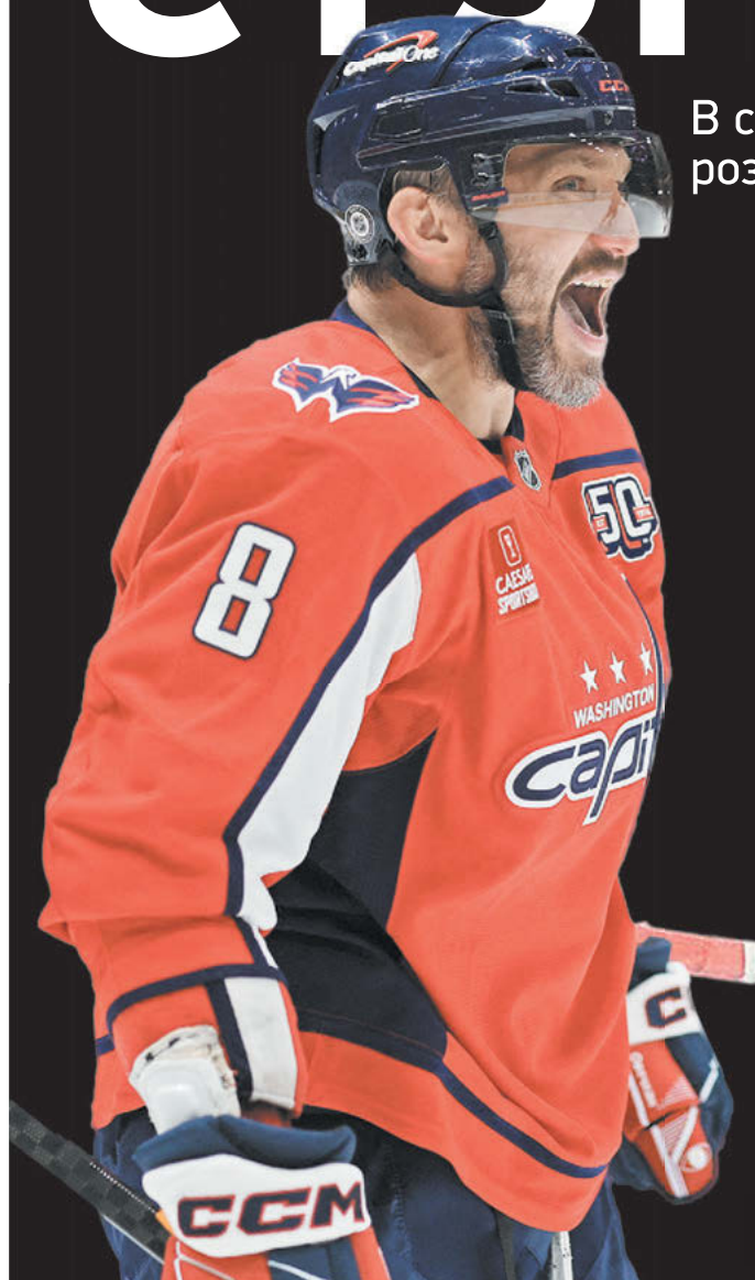
Форвард «Вашингтона» Александр Овечкин

В субботу, 19 апреля, стартует розыгрыш плей-офф НХЛ-2025