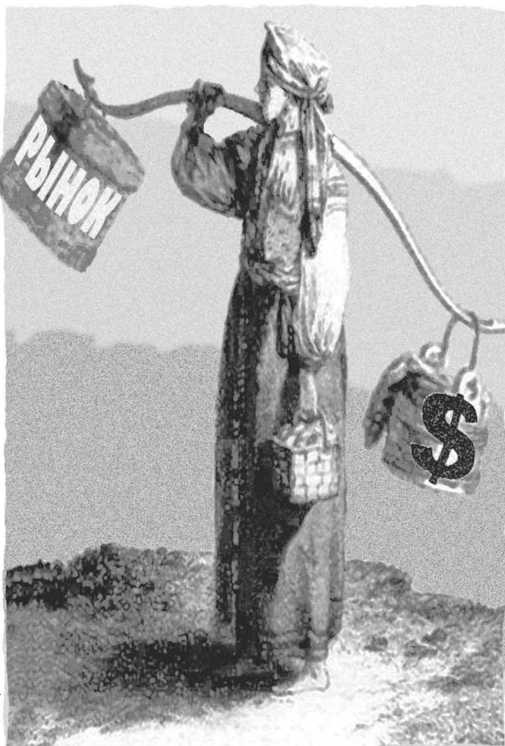
ИЛЛЮСТРАЦИЯ КОНСТАНТИНА БАЛОВА

Многочисленные аналитики, пророчившие рублю плохое самочувствие этой весной, пока сидят в луже. Несмотря ни на какие прогнозы, наша валюта продолжает укрепляться. Так, во вторник доллар упал до 34,4 рубля, а евро — до 44,80 рубля. Стоимость же бивалютной корзины вплотную приблизилась к 39 рублям (при верхней планке, установленной ЦБ, в 41 рубль). Ни власти, ни население не сомневаются, что граница будет на замке и впредь. По крайней мере до 1 июня. → стр. 9