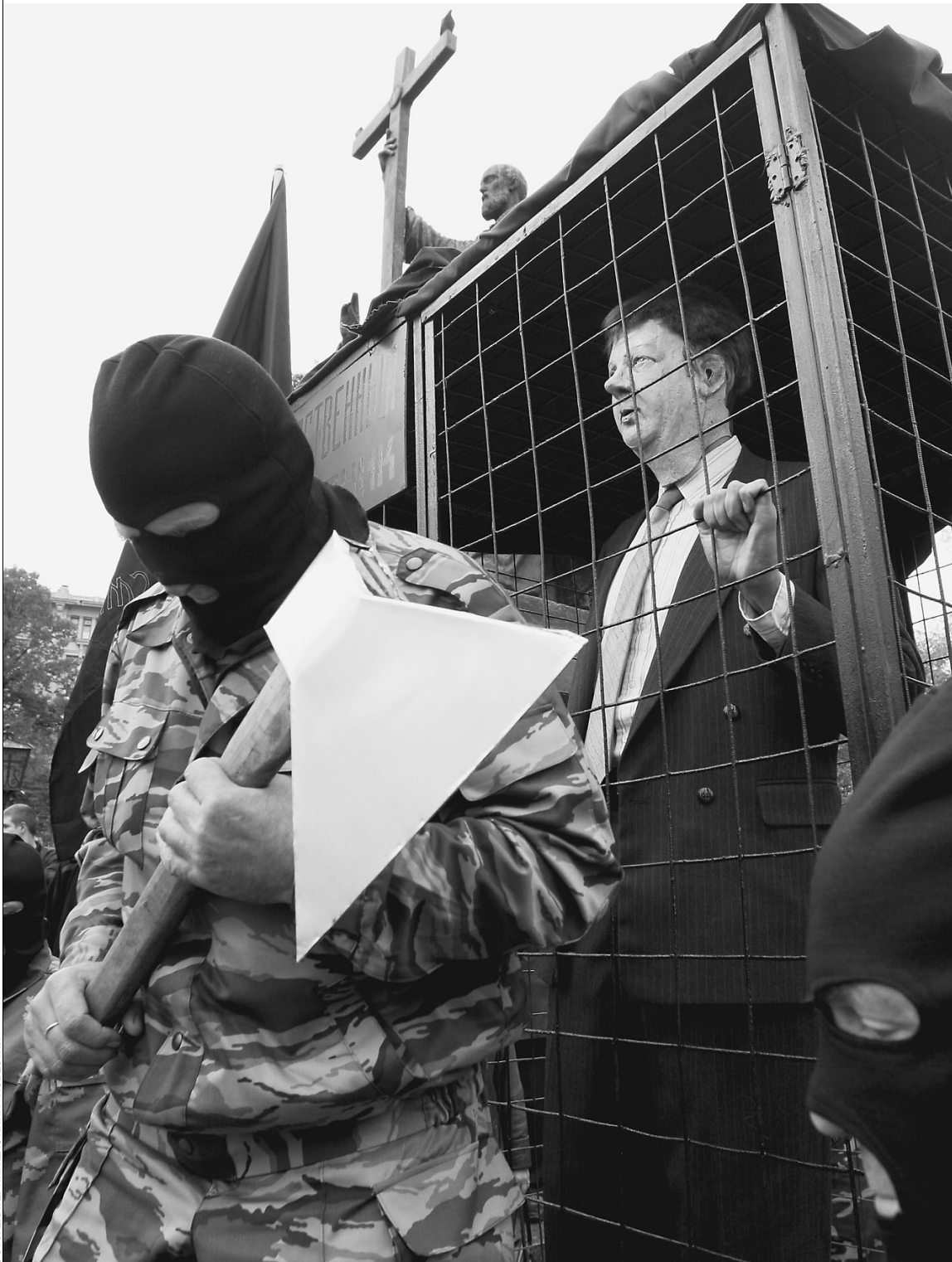
Национал-патриоты продолжают репетировать «казнь» Чубайса

«Известия» располагают эксклюзивными материалами по делу о покушении на Анатолия Чубайса