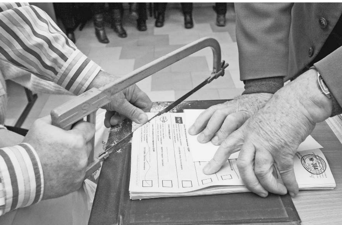
Места в будущей Госдуме «распилят» между собой четыре партии. В крайнем случае, пять

Спустя две недели после проведения выборов в 14 регионах страны, когда страсти по ним в основном уже улеглись (только в Туве местные «эсеры» еще голодают), члены Политклуба «Известий» собрались, чтобы без суеты и телекамер поговорить на тему «Перспективы федеральных выборов после региональной избирательной кампании. Какие партии и идеи в наибольшей степени отвечают настроениям российского общества?». Это было первое заседание Политклуба, в котором приняли участие и политики, иологи. Мы предлагаем вам самые интересные фрагменты многочасовой беседы. → стр. 3