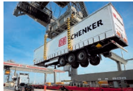
Обложка Погрузка полуприцепа компании DB Schenker на платформу