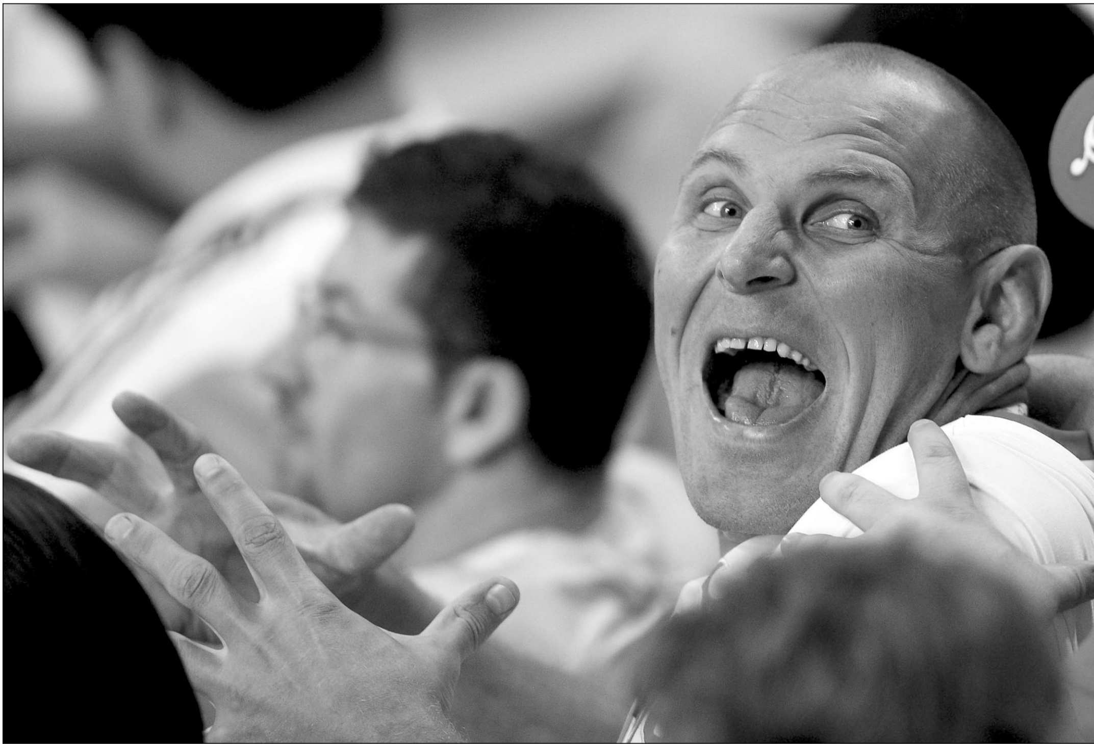
Вчера. Пекин. Счастье трехкратного олимпийского чемпиона по греко-римской борьбе Александра КАРЕЛИНА.

Подобности побед российских борцов - стр. 9