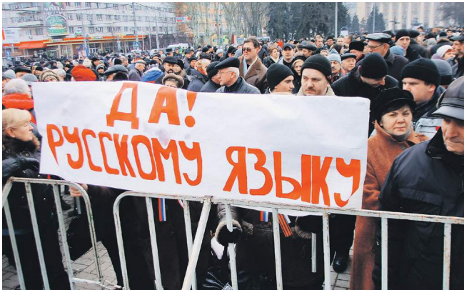
Первый раз документ в поддержку русскоязычного населения пытались внести в конце декабря

— Я обязательно внесу этот законопроект в Верховную раду повторно. Более того, планирую сделать это в ближайшее вре-