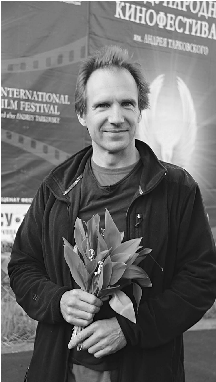
Рэйф Файнс на кинофестивале в Иванове

В Иванове завершился V Международный фестиваль «Зеркало». Большое жюри возглавлял выдающийся британский актер Рэйф Файнс. Дважды номинант на премию «Оскар» и исполнитель роли Онегина в одноименном фильме впервые оказался в русской провинции и увидел Волгу →06