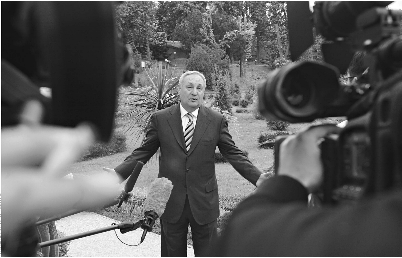
Сергей Багапш считался самым открытым для прессы президентом на Кавказе

Врачи говорят, что им для этого не хватило всего недели