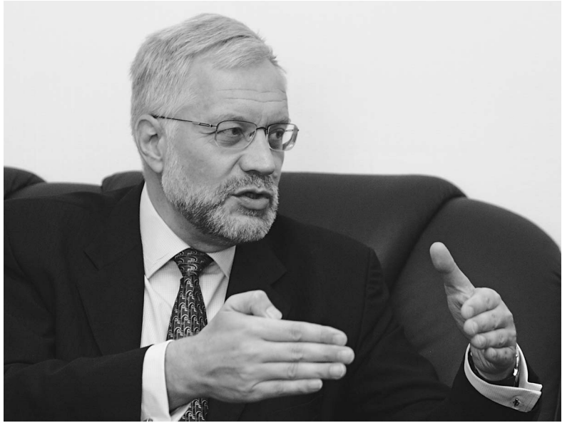
Григорий Марченко: «Я знаю, как МВФ работает изнутри»