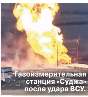
Газоизмерительная станция «Суджа» после удара ВСУ.

17 апреля истекает срок объявленного в рамках российско-американских договоренностей моратория на взаимные удары РФ и Украины по энергообъектам друг друга. Продление договоренности под вопросом из-за позиции Киева. Украина все это время продолжала бить по российским