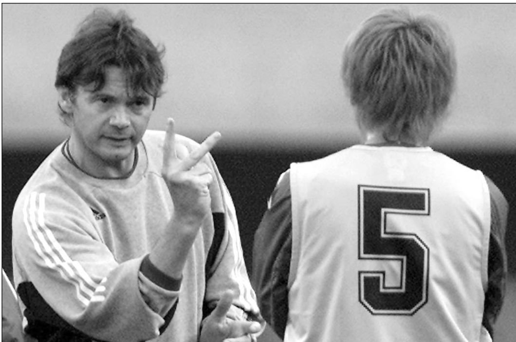
Этот снимок сделан в дни ЧМ-2002, когда французский специалист Филипп ТРУССЬЕ возглавлял - и не без успеха - команду Японии. Теперь он не скрывает, что мечтал бы встать у руля сборной России.

«С» ПОРТ-ЭКСПРЕСС» не первый год отстаивает позицию: оптимальный вариант для сборной России в сложившейся ситуации - иностранный тренер. Как свидетельствуют последние высказывания Вячеслава Колоскова, он теперь тоже не исключает подобного развития событий. Пусть и не в ближайшее время - завершать отборочный турнир ЧЕ-2004 почти наверняка придется отечественному специалисту. Главные аргументы тех, кто против приглашения тренера-иностранца, таковы: а) все достойные люди заняты, б) нам никто не захочет поехать, в) тренер-легионер не сможет работать с российскими футболистами. При этом есть по крайней мере одна кандидатура, которая блистательно разбивает все эти доводы. Еще год назад мы называли имя Филиппа Труссье. Француз испытывает огромное уважение к России и ее футболу. Победу руководимой им сборной Японии над нашей командой на чемпионате мира-2002 по сей день считает самым важным матчем в своей тренерской карьере. И - самое главное - не то что хочет, а горит желанием возглавить сборную России.