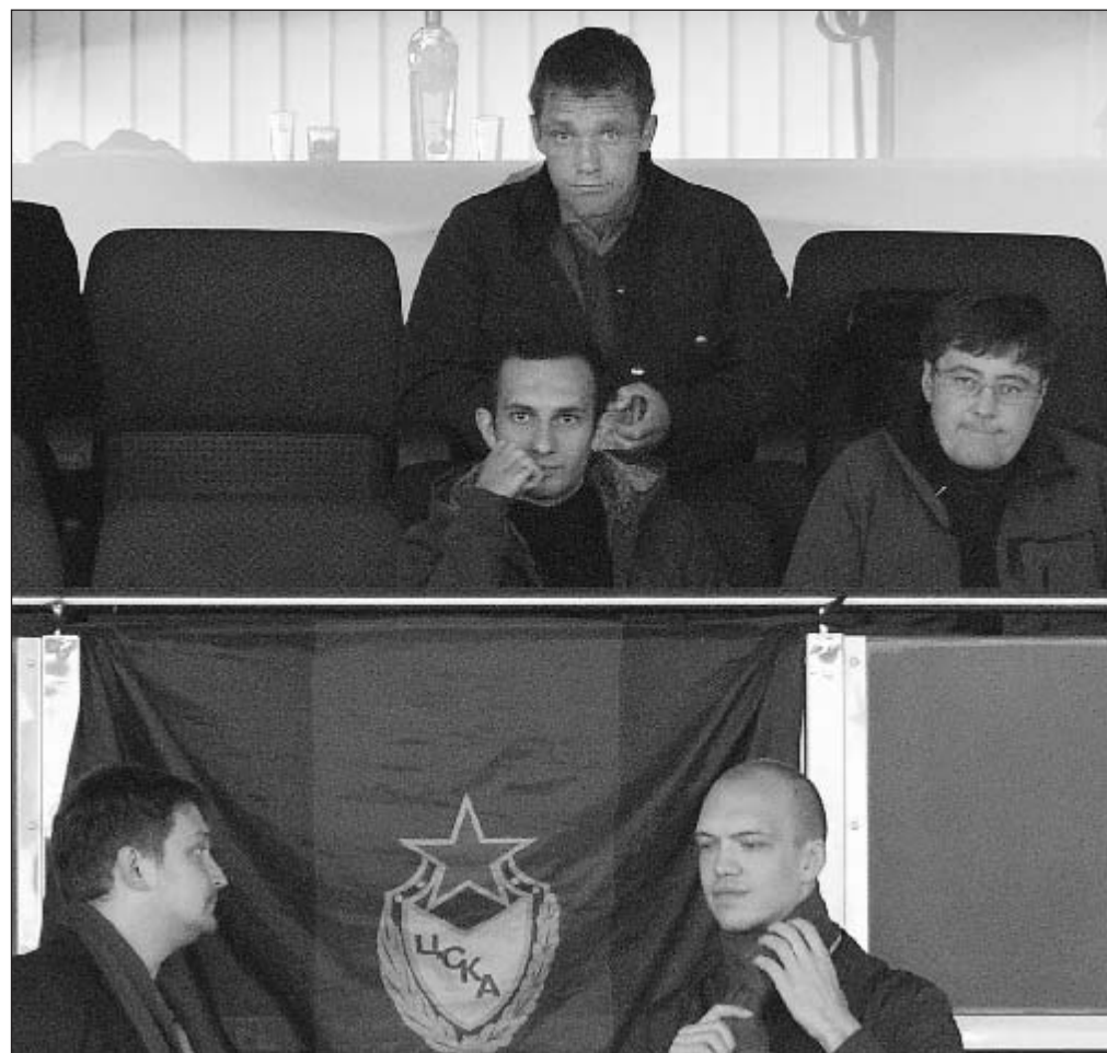
Виктор ГОНЧАРЕНКО на матче ЦСКА - «Зенит».