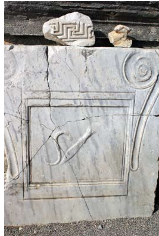
Фонтан, получавший питание из акведука

Вдоль улицы тянутся руины христианской базилики — их раскопки еще впереди.