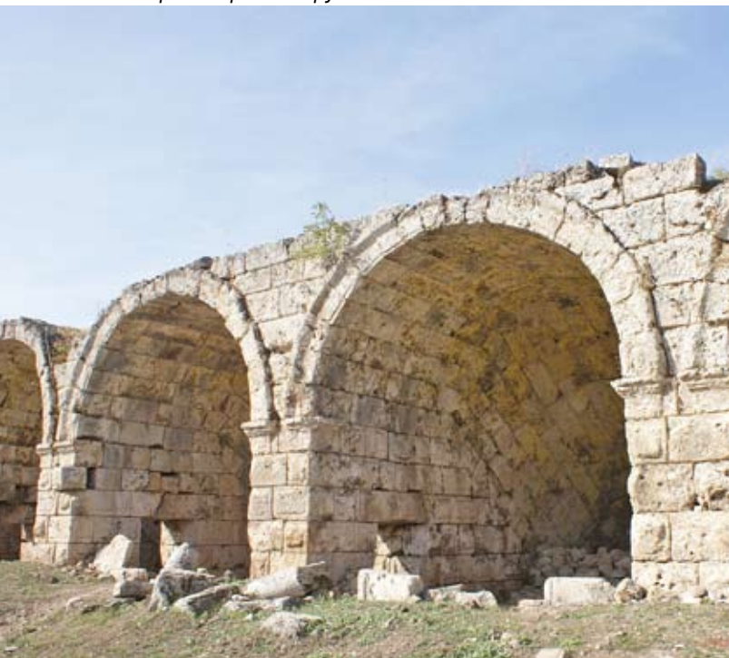
Торговые ряды вокруг стадиона

Как знать, может, на такое сравнение апостола Павла подвигли соревнования, происходившие именно на этом стадионе?