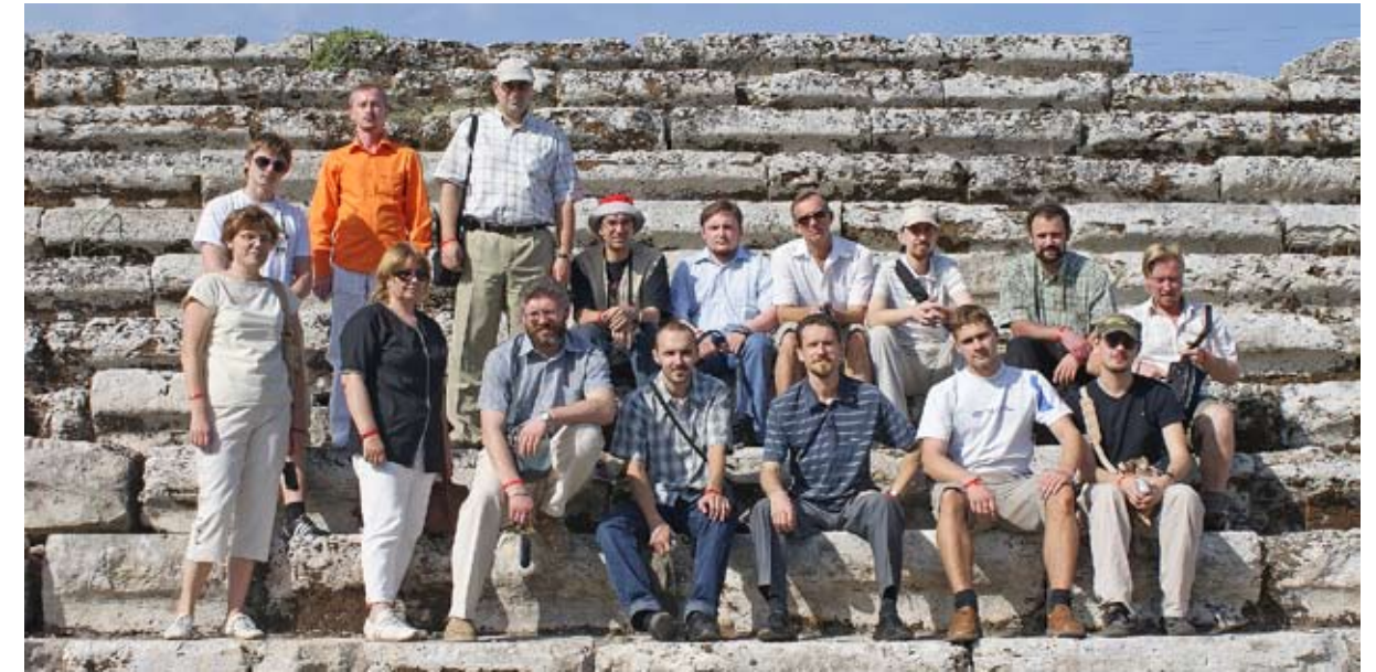
Так мы представили себя в роли первых слушателей апостола Павла

Интересно, что все пространство этого внушительного сооружения было использовано жителями не только по прямому назначению, но также и для нужд городской жизни. Например, боковые ниши составляли торговые ряды (некий прообраз современных торговых павильонов). Стадион был местом встреч горожан, диспутов, споров и обсуждения новостей.