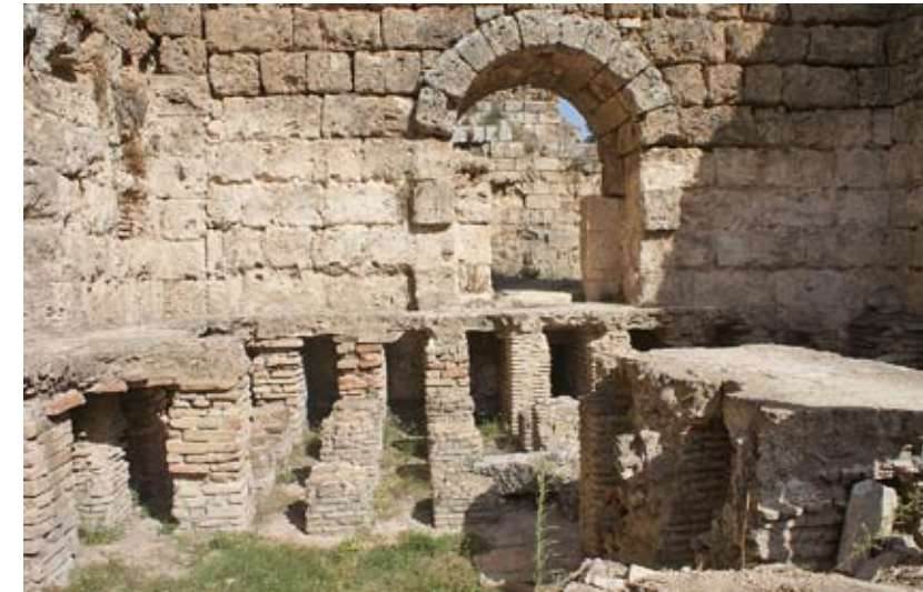
Термы имели сложную подземную систему подогрева полов горячим воздухом

По сути, это были не столько бани, сколько места для полноценного отдыха и проведения досуга. Хорошо сохранились и подземные коммуникации — система подачи и нагрева воды. Обращают на себя внимание характерные апсиды вдоль одной из стен. Можно предположить, что в состав комплекса входили и некие религиозные сооружения. Древняя Пергия оставляет еще немало интересных вопросов. ■