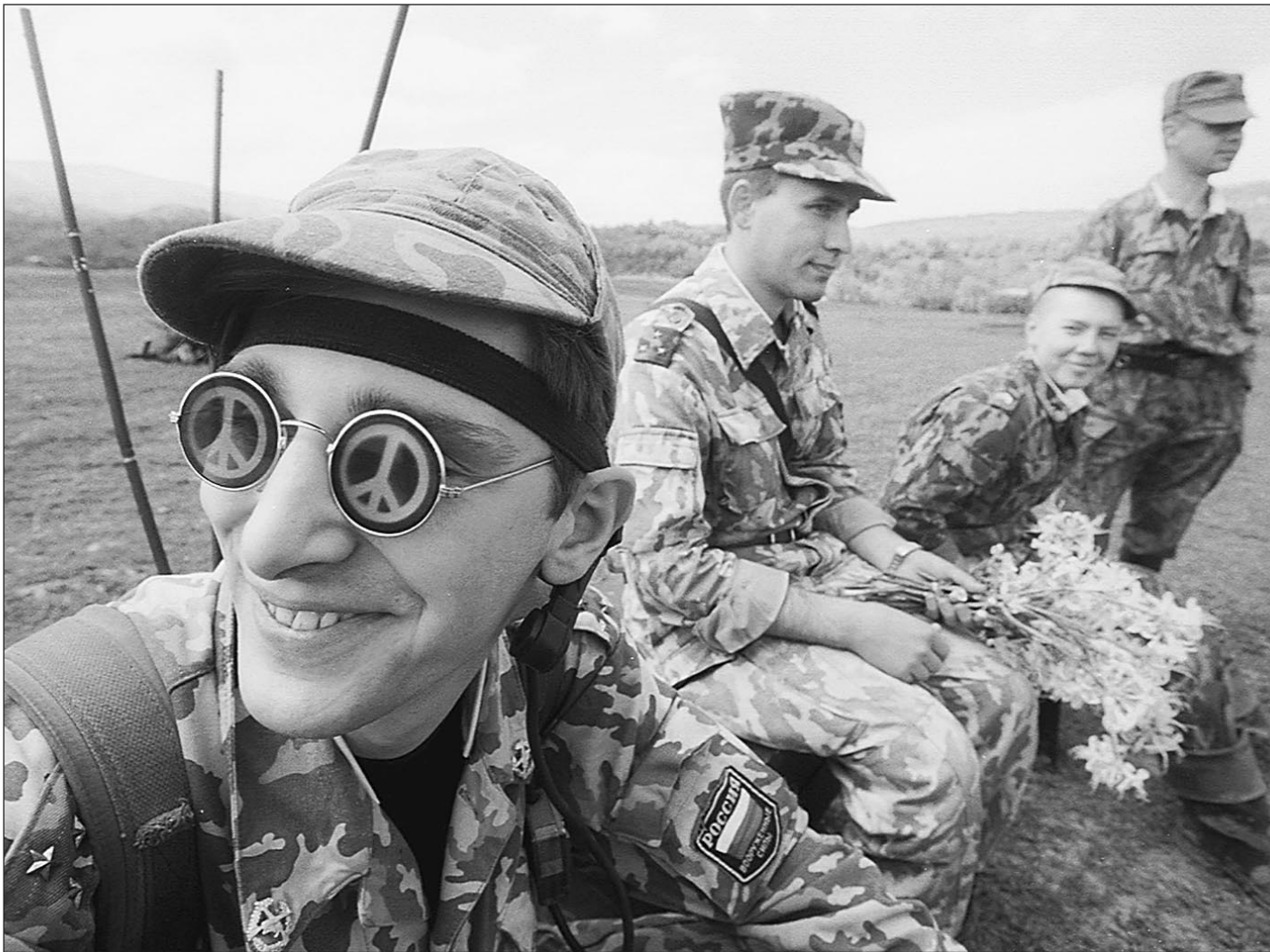
Никто не закрывает глаза на терроризм