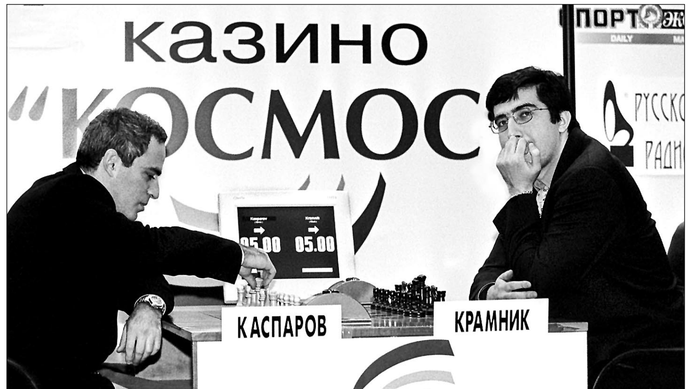
Вчера. Москва. Гарри КАСПАРОВ делает первый ход в суперматче с Владимиром КРАМНИКОМ.

В третьей партии Крамник неожиданно применил французскую защиту. Каспаров, в долгу не остался, он ушел от всех современных продолжений и выбрал своего рода старинную защиту - в первой руке, как говорили шахматисты старшего поколения. Белые получили огром-