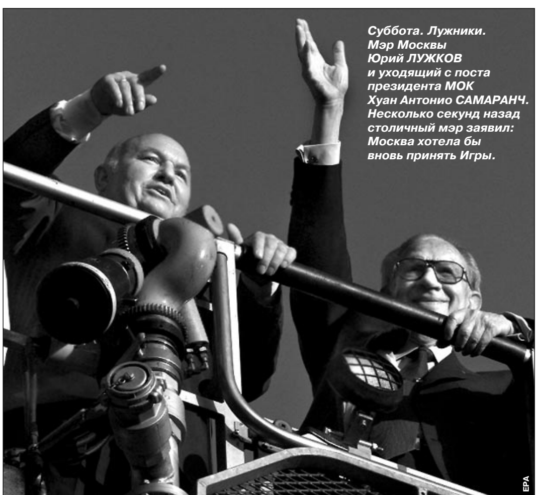
Суббота. Лужники. Мэр Москвы Юрий ЛУЖКОВ и уходящий с поста президента МОК Хуан Антонио САМАРАНЧ. Несколько секунд назад столичный мэр заявил: Москва хотела бы вновь принять Игры.

В субботу, всего сутки спустя после признания Пекина олимпийской столицей-2008, Юрий Лужков объявил, что Москва готова вступить в предвыборную гонку за Олимпиаду-2012.