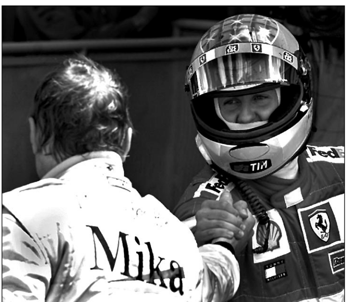
Вчера. Сильверстоун. Михаэль ШУМАХЕР (справа) поздравляет Микку ХАККИНЕНА с победой.

Кстати, подобные серии бывали и у других чемпионов мира. Так, тот же Шумахер не мог выиграть 12 гонок подряд - с мая 99-го по март 2000-го. Аллен Прост, в 90-м в последний раз выигравший на «Феррари» (сентябрь, Испания), - следующую победу одержал лишь в 93-м в ЮАР - спустя 16 «Гран-при» (напомним, что в 92-м француз не выступал). Но больше всех «на диете» был чемпион мира-96 Дэмун Хилл. После победы