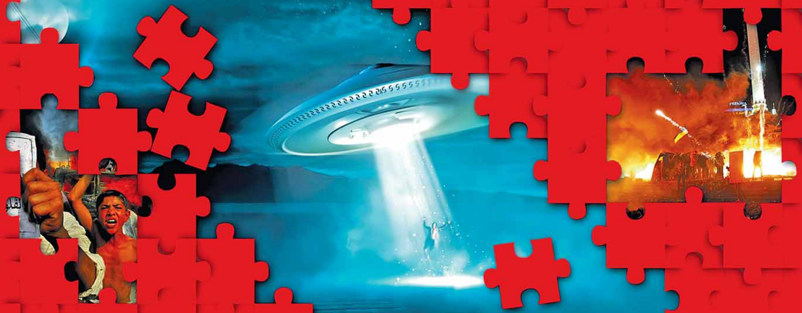
Коллаж Андрея СЕДЫХ