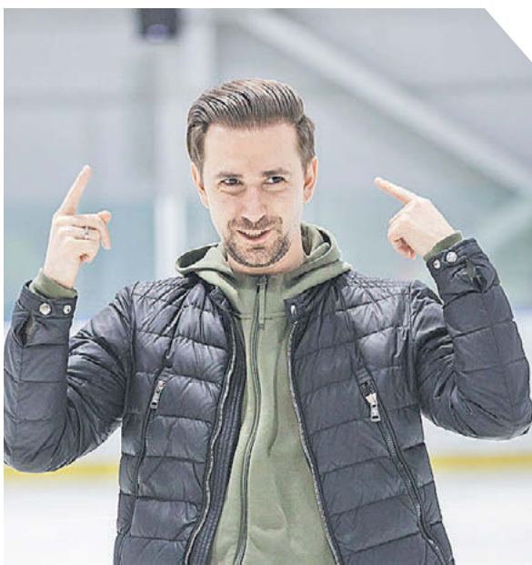
Global Look Press