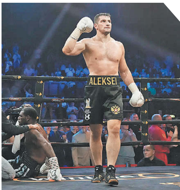
Дмитрий Каратаев «Известия»