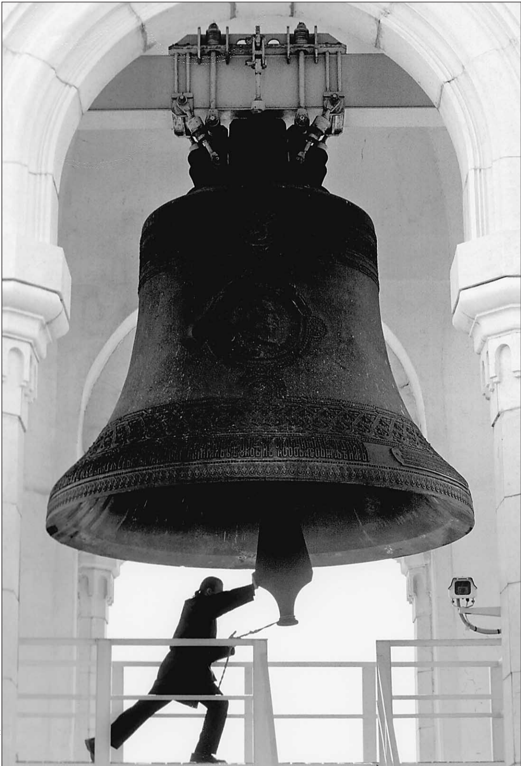
Не спрашивай, по ком звонит колокол. Он звонит по тебе