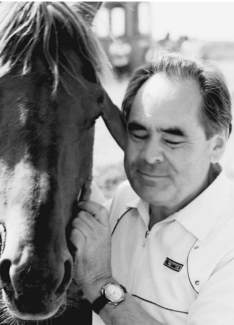
ПРЕЗИДЕНТ ТАТАРИИ со своим любимцем