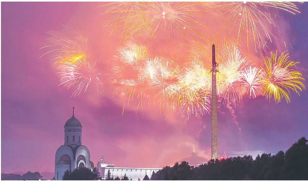
Таким будет салют в ознаменование освобождения Варшавы от немецких оккупантов, который будем наблюдать в Москве 17 января.

Минобороны России накануне 75-летия освобождения Варшавы от немецко-фашистских оккупантов опубликовало ряд рассекреченных документов