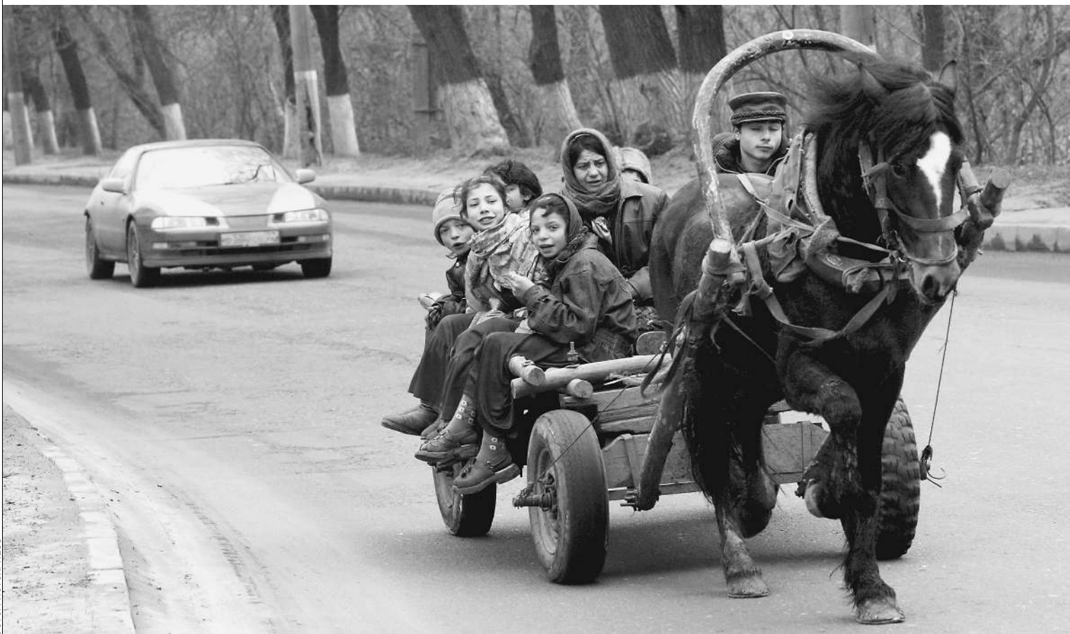
Этой осенью цыгане стали причиной конфликтов сразу в нескольких регионах России

Вот неполный список антицыганских акций, предпринятых в разных концах России минувшей осенью. В Калининграде по решению суда полным ходом идет снос незаконно построенных цыганских особняков. Аналогичное решение уже принято властями Архангельска. Случаи избиения и погромов цыган зафиксированы в Санкт-Петербурге, Пскове, Кургане, Белгороде, Екатеринбурге. Своего рода генеральное сражение между правами человека и правом жить без наркотиков развернулось в городе Искитим Новосибирской области.