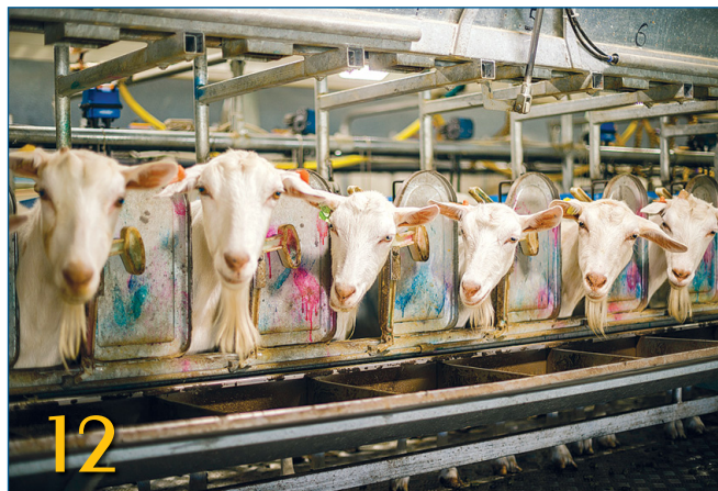
ОТ САМОЙ КРУПНОЙ КОЗЬЕЙ ФЕРМЫ В РОССИИ К САМОЙ КРУПНОЙ В МИРЕ!