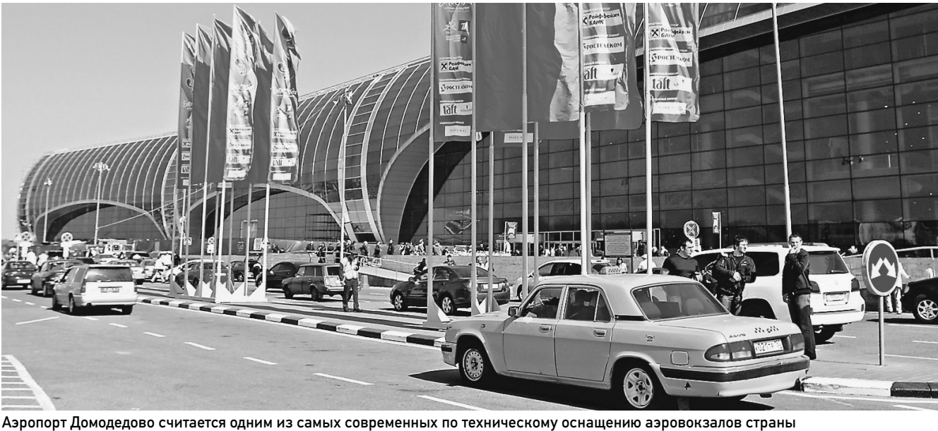
Аэропорт Домодедово считается одним из самых современных по техническому оснащению аэровокзалов страны

«Левые» программы и оборудование использовались в системах аэронавигации и безопасности аэропорта