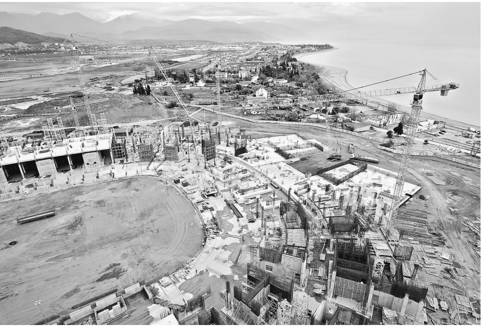
В Сочи строительство стадиона к чемпионату мира по футболу уже началось