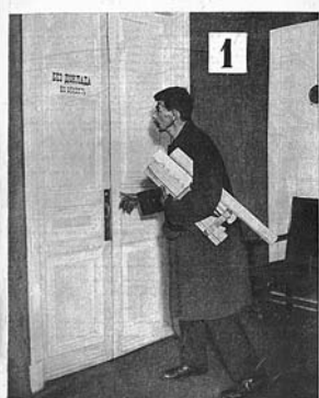
ДВЕРИ ДОЛЖНЫ РАСПЯХИВАТЬСЯ!

Первый номер журнала «ИЗОБРЕТАТЕЛЬ» открывает статья Альберта Эйнштейна «Массы вместо единиц», где великий ученый говорит, что время гениальных изобретателей-одиночек прошло, наступает замечательная эпоха коллективного изобретательства. В этой январской книжке новорожденного издания блистательный подбор авторов. Со статьями выступают крупные государственные и партийные деятели — В.Куйбышев, Л.Каменев, замечательные писатели — М.Пришвин, В.Шкловский, Н.Погодин, знаменитый журналист М.Кольцов, академики, выдающиеся инженеры и простые рабочие. Печатается бюллетень важнейших государственных решений по изобретательским делам, в том числе о привилегиях, помогавших тогдашним изобретателям жить и заниматься творчеством.