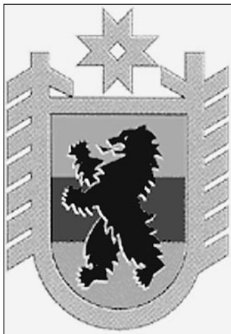
Герб Карелии пока останется без изменений

В 1995 году законопроект появился уже в Госдуме и дорабатывался до 1997 года. За эти два года президент трижды отпирал его на доработку. На этот раз в Госдуму законопроект поступит в прежнем виде, без доработки.