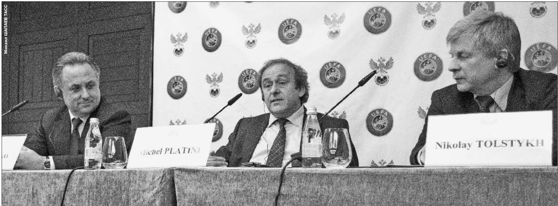
Вчера. Москва. Виталий МУТКО, Мишель ПЛАТИНИ и Николай ТОЛСТЫХ.

Вчера президент УЕФА Мишель Платини сделал ряд громких заявлений на встрече с российскими журналистами по итогам рабочей поездки в Москву, в ходе которой он провел переговоры с министром спорта РФ Виталием Мутко и президентом РФС Николаем Толстых. Обозреватель «СЭ» проанализировал высказывания Платини и пришел к нескольким любопытным выводам.