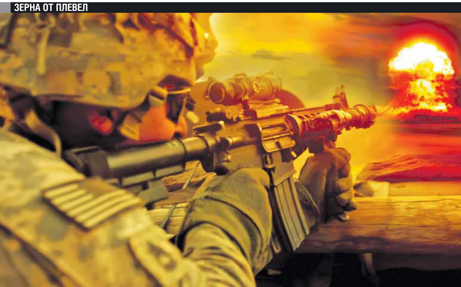
Коллаж Андрея СЕДИХ