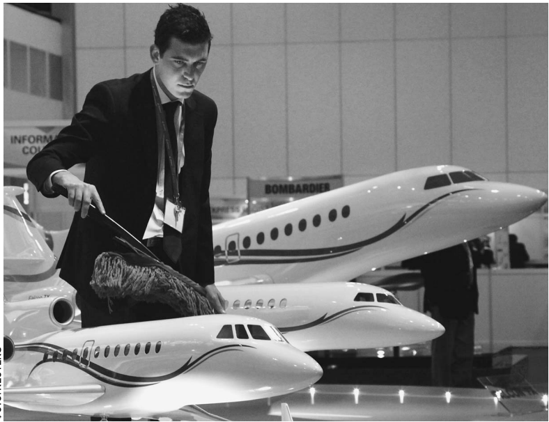
В борьбе за пассажира авиакомпания охотно наводит лоск, но цены снижают крайне неохотно