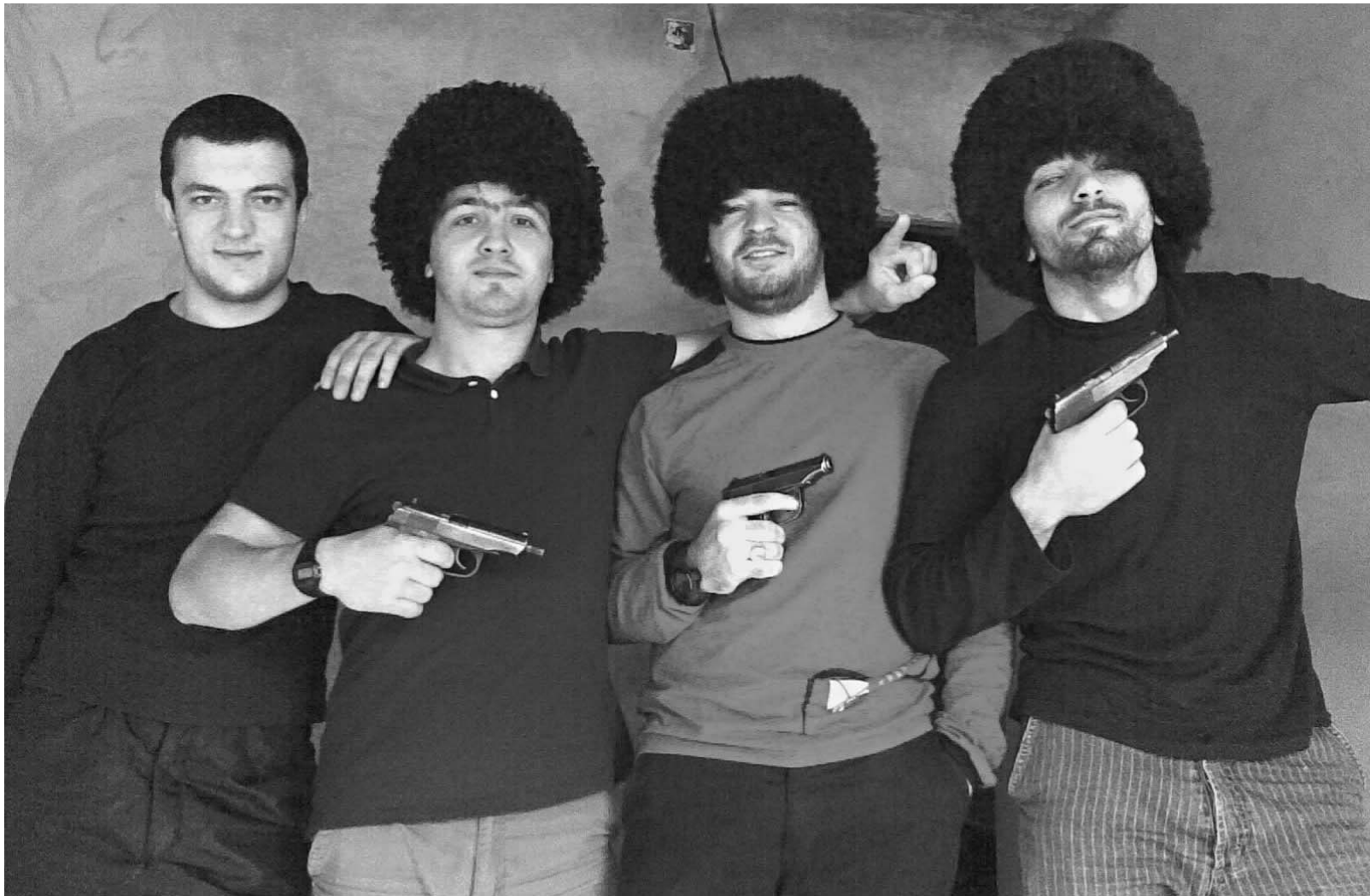
Молодых людей манит прежде всего оружие. Религиозный фанатизм приходит позже

На юге России бандформирования работают по бизнес-планам