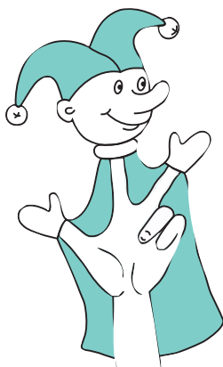
Рис. 1. Кукла-петрушка

Предшественником всех разновидностей верховой куклы является т. н. кукла-петрушка (рис. 1), т. е. кукла, надеваемая на руку актёра и не имеющая никаких дополнительных приспособлений для управления ею. Имя своё она получила от героя старинных народных кукольных представлений – весёлого озорника Петрушки. Перчатка является одновременно и костюмом куклы.