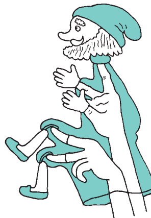
Рис. 2. Управление куклой-петрушкой

Ноги у кукол-петрушек бывают далеко не всегда. Кукла становится ногами на ширму лишь в очень редких случаях, т. к. при этом бывает видна рука актёра. В некоторых случаях руку актёра удаётся более или менее удачно замаскировать длинным платьем или плащом (рука проходит между подкладкой и верхом) (рис. 2). Но это допустимо, разумеется, далеко не в каждой пьесе и не для каждого персонажа. Кроме того, кукла, стоящая ногами на ширме,