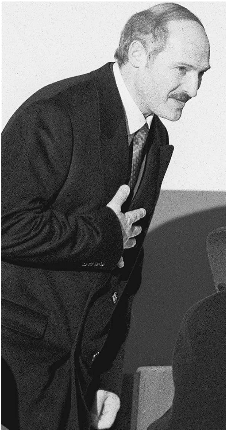
Александр Лукашенко: полтора миллиарда долларов стоят того, чтобы идти на поклон

Нелегкие времена настали для президента Белоруссии Александра Лукашенко. Экономика его страны, похоже, начала разваливаться. И виной тому новогодний нефтегазовый конфликт с Россией. Из-за повышения цен на нефть и газ в бюджете республики скоро может появиться огромная дыра. А денег взять неоткуда. Вот и пришлось Лукашенко официально попросить у России в долг полтора миллиарда долларов. Со свойственной ему скромностью белорусский лидер попросил не под проценты, а просто так. Дадим ли мы ему столько денег и зачем нам это нужно?