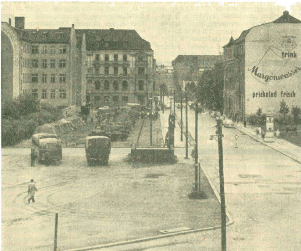
Типичная картина на улицах Восточного Берлина сегодня. Символ режима — танки

тавлял впечатление общественного организма с огромными внутренними трудностями, ведущего отчаянную борьбу за удержание порядка.