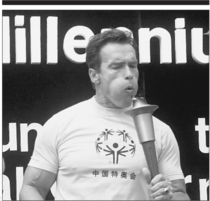
Арнольд Шварценеггеру сегодня — 55