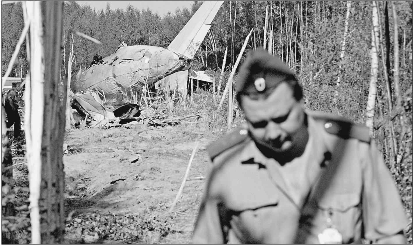
На месте падения Ил-86