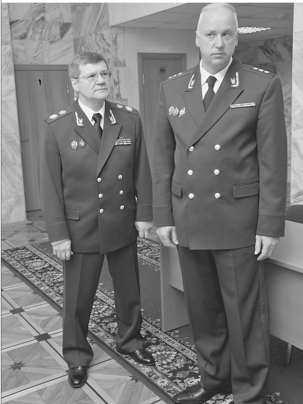
Генпрокурор Юрий Чайка (слева) и глава СКП Александр Бастрыкин : для общества важнее всего, чтобы они добивались безусловного наказания виновных

Верховный суд признал генпрокурора главным не только для прокуроров, но и для сотрудников Следственного комитета