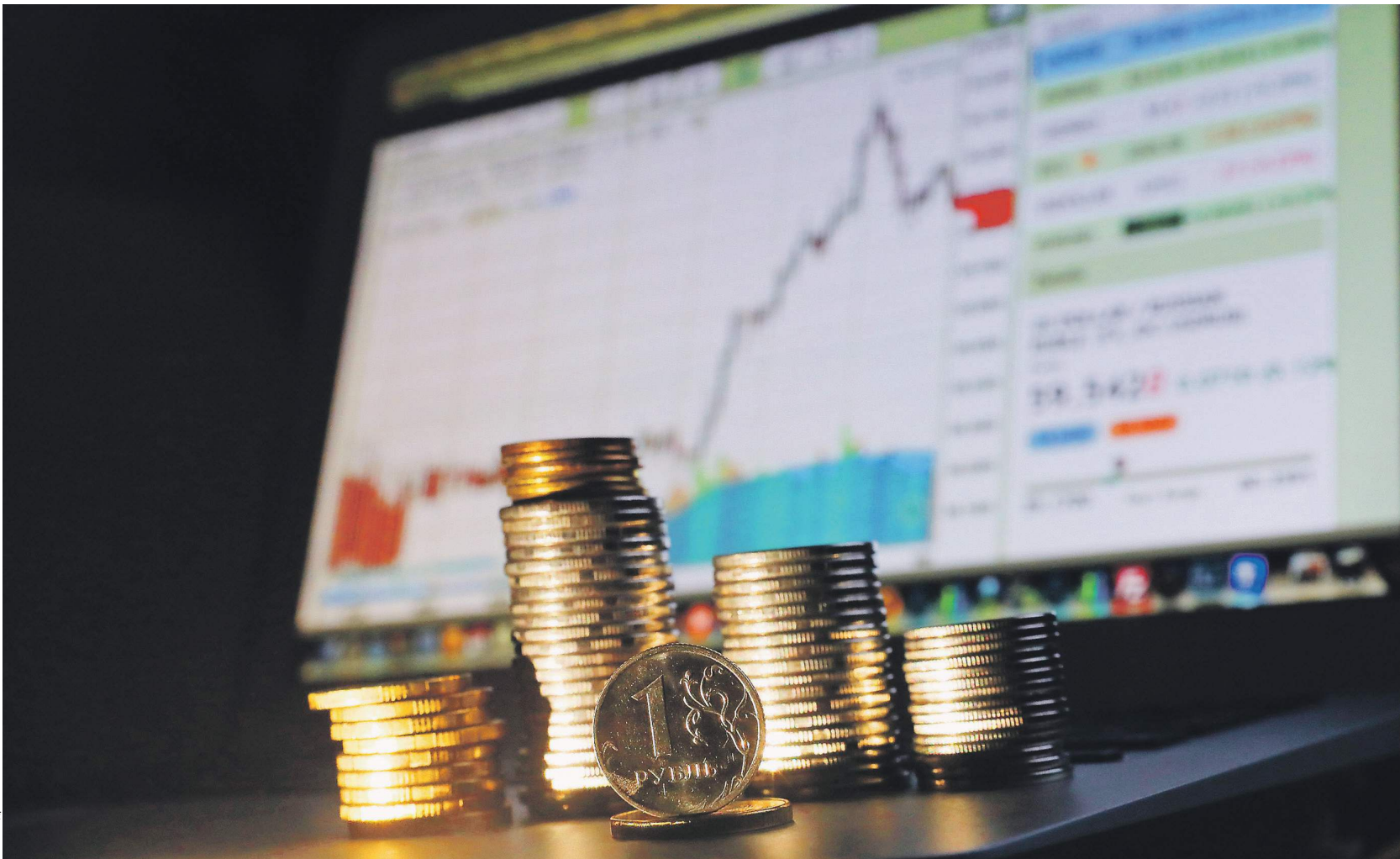
Игроки перестали опасаться продолжения спада экономики, взлета процентных ставок, обвала цен на нефть, санкций и волатильности курса рубля