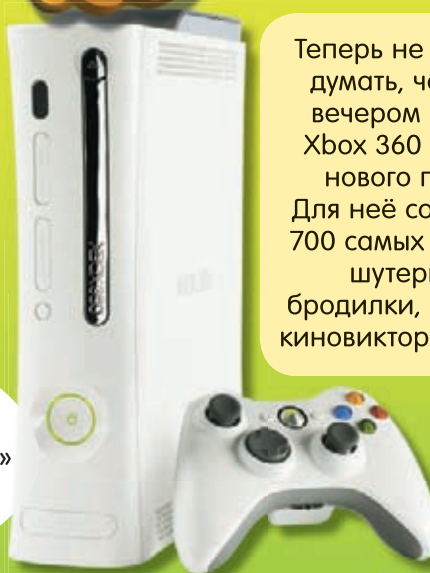
Иллюстрация на обложке: Двадцатый Век Фокс СНГ

Теперь не нужно долго думать, чем заняться вечером с друзьями! Xbox 360 – приставка нового поколения. Для неё создано более 700 самых разных игр – шутеры, гонки, бродилки, головоломки, киновикторины и другие!