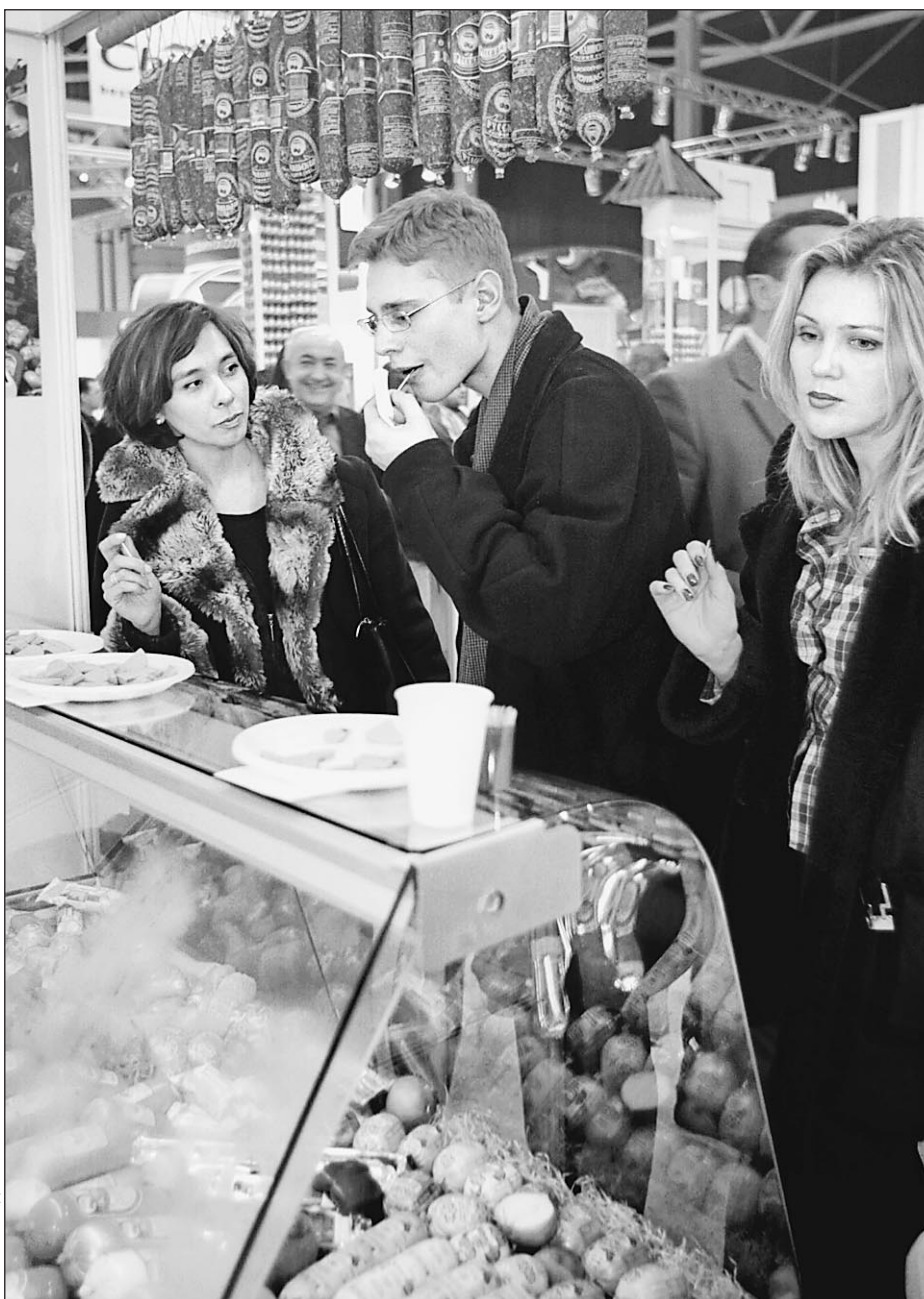
...нет у консумации конца