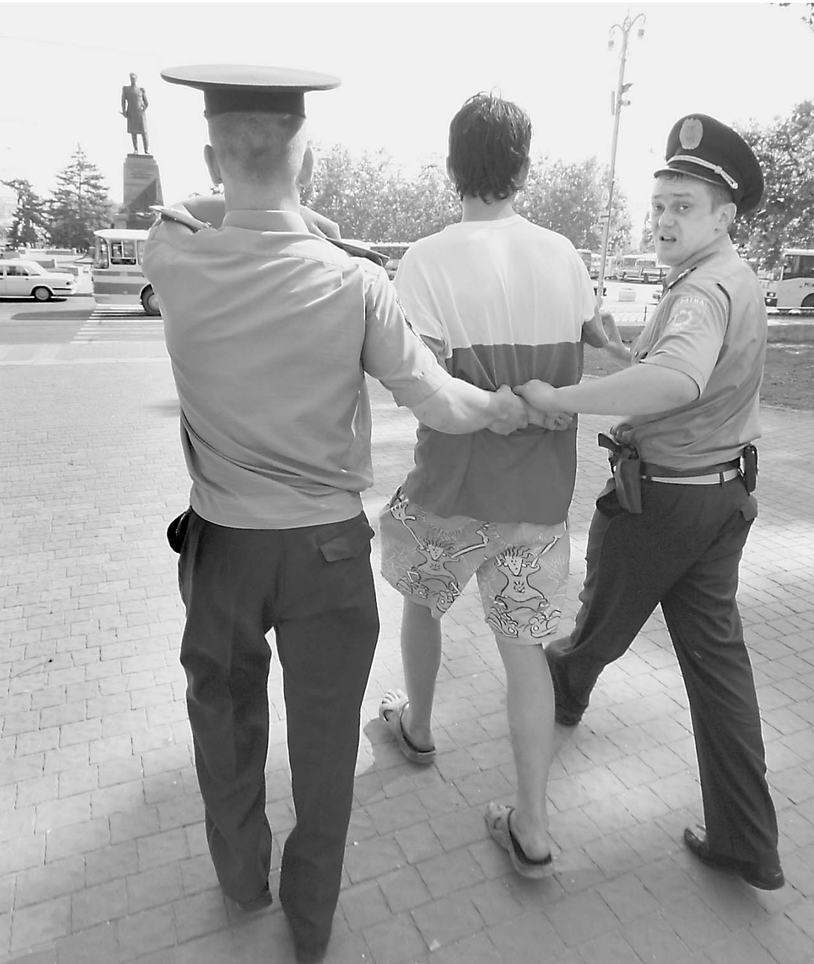
Крым. Севастополь. Украинская милиция задерживает митингующего, одетого в майку цветов российского флага

Жестче всех отреагировал на признание независимости Южной Осетии и Абхазии Виктор Ющенко — на полуострове идет перепись обладателей российских паспортов