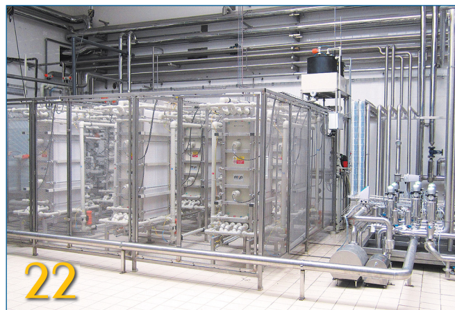
С НОВЫМИ ТРЕБОВАНИЯМИ – К НОВЫМ ГОРИЗОНТАМ