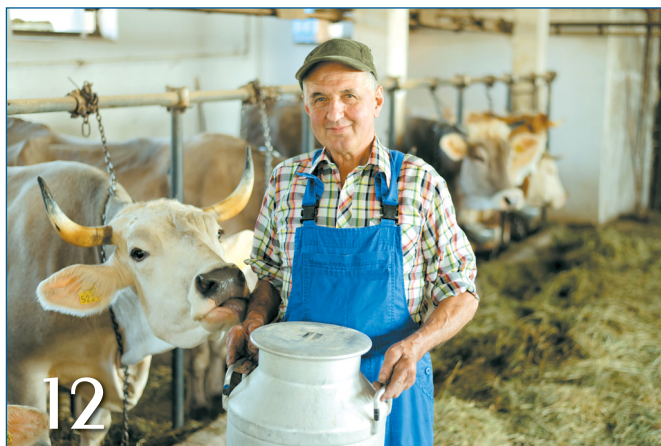
АНАЛИЗ И ПЕРСПЕКТИВЫ РОССИЙСКОГО РЫНКА СЫВОРОТОЧНЫХ ИНГРЕДИЕНТОВ