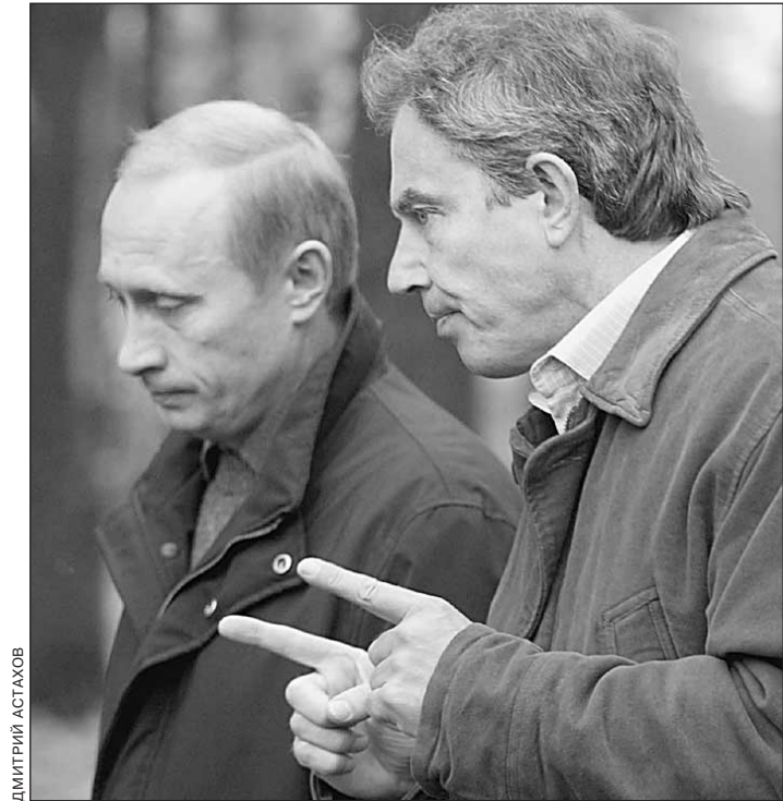
Путин и Блэр. Встреча в Завидово

Второй «кит» — прагматический. Путин признает, что те государства, которые выступают против жесткого решения, имеют