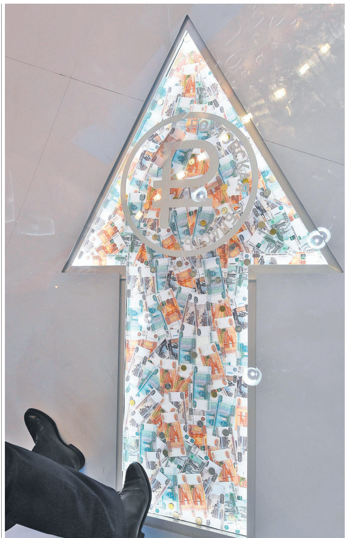
В банках пытаются обеспечить квалифицированным сотрудникам развитие в правильном направлении

На самом деле великим игроком, которого, не дожидаясь для спокойной и объективной оценки совершенного в карьере ее окончания, без колебаний можно ставить в ряд с когортой отечественных хоккейных легенд далекого и недалекого прошлого: Анатолием Фирсовым и Константином Локтевым, Валерием Харламовым и Владиславом Третьяком, Борисом Михайловым и Александром Рагулиным, Валерием Васильевым и Александром Мальцевым, Вячеславом Фетисовым и Игорем Ларионовым, Александр Овечкин был признан давно. Из-за гигантской коллекции личных призов, добытых в НХЛ, включающей два приза лучшему хоккеисту сезона.