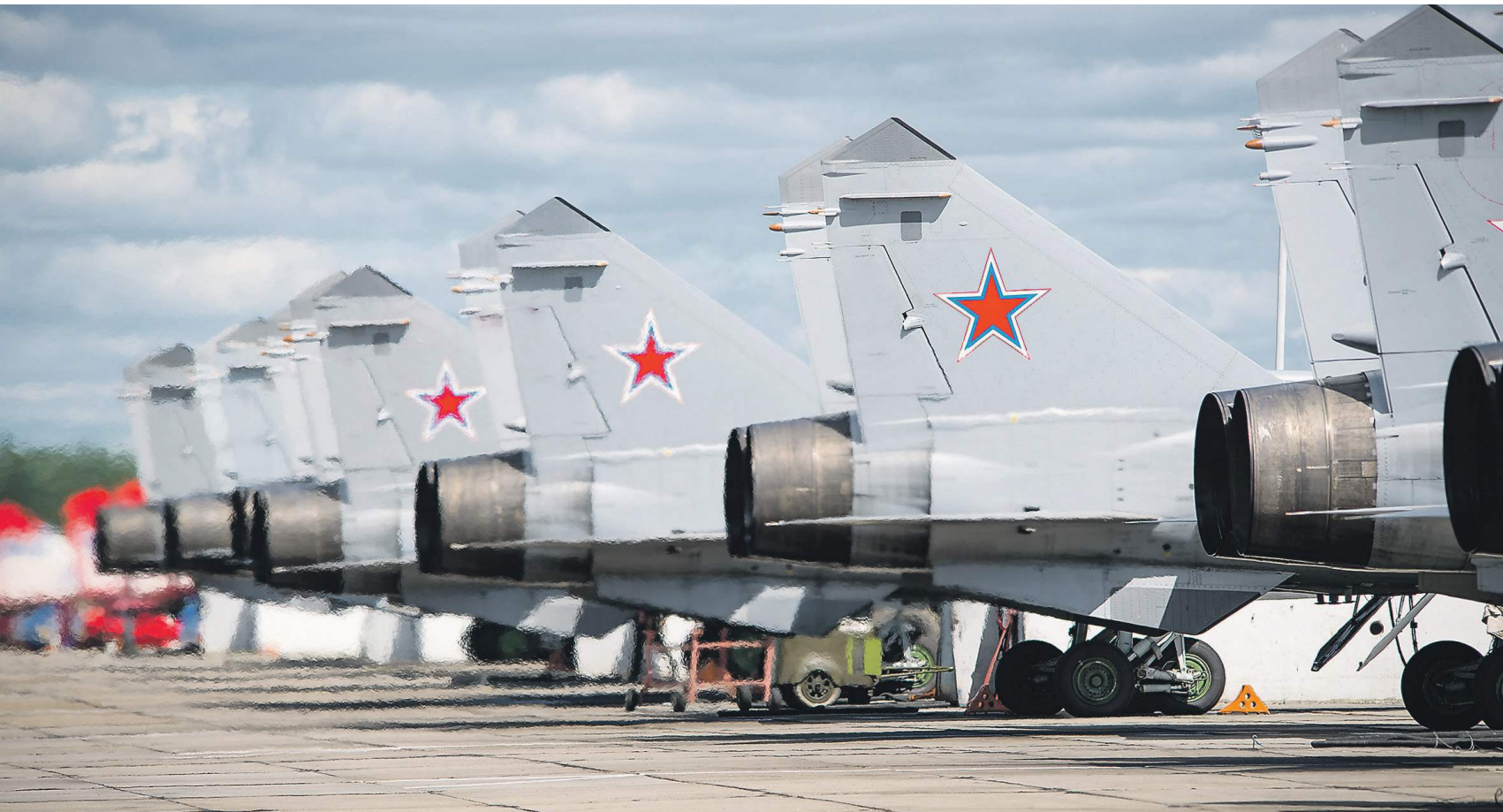
Новая воздушная армия станет важнейшим элементом безопасности России в Арктике и на Тихом океане

Одновременно с формированием тихоокеанской армии ВВС и ПВО меняется структура авиационных сил. Вместо созданных после не совсем удачной реформы 2008 года аморфных и плохо управляемых авиабаз воссоздаются полки и дивизии. В состав смешанных авиаполков наряду с эскадрильями противолодочных