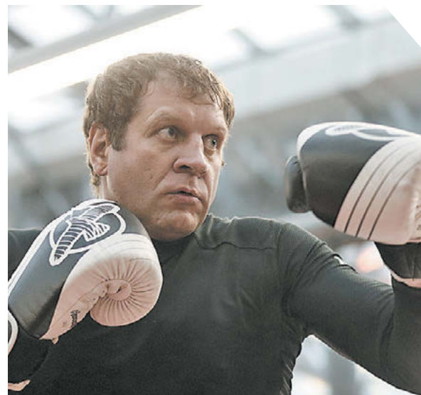
Дарья Исаева «СЭ» / Canon EOS-1D X Mark II