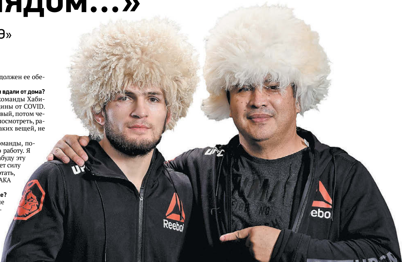
Хабиб Нурмагомедов и Хавьер Мендес